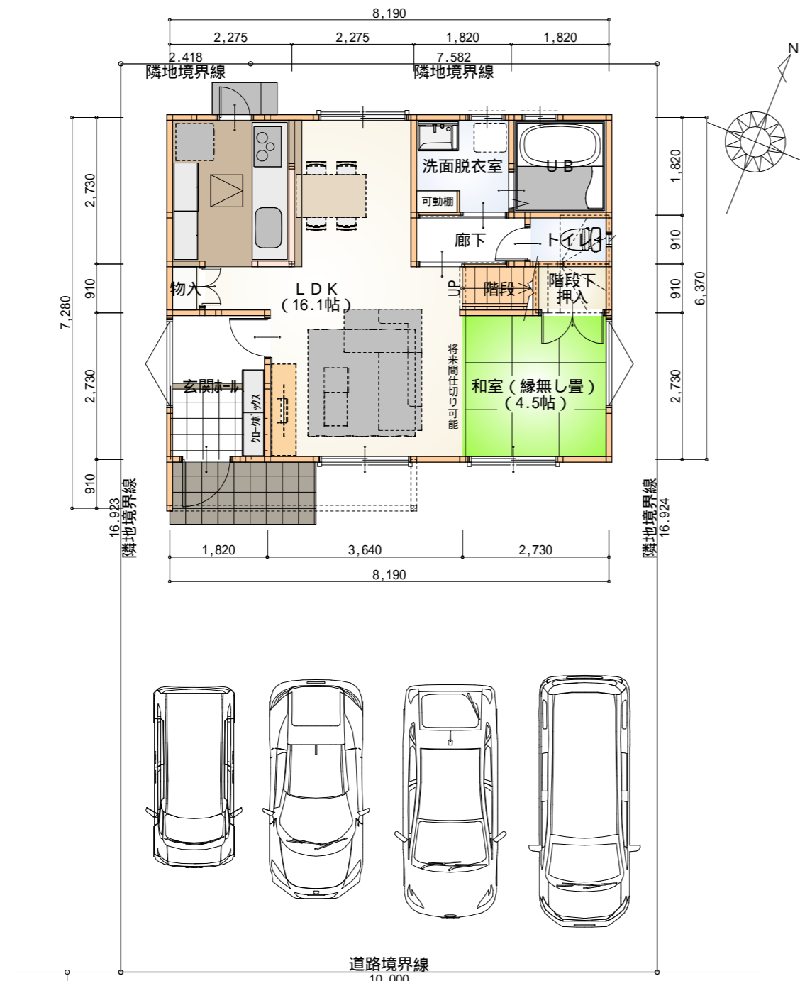
1階平面図兼配置図