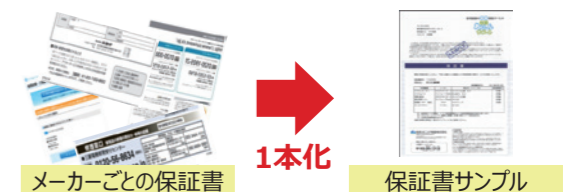
メーカーごとの保証書

メーカーごとの保証書・連絡先を探すお手間をなくし、スムーズな対応をご提供します。