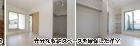
充分な収納スペースを確保した洋室