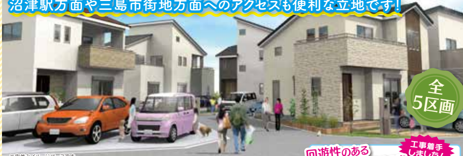
※街並みイメージです

閑静で暮らしやすく、近隣商業施設も充実した分譲地！ 沼津駅方面や三島市街地方面へのアクセスも便利な立地です！